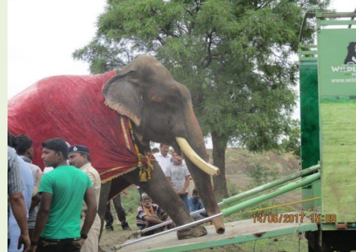
上圖：Gajraj 被鍊乞討受虐 51 年